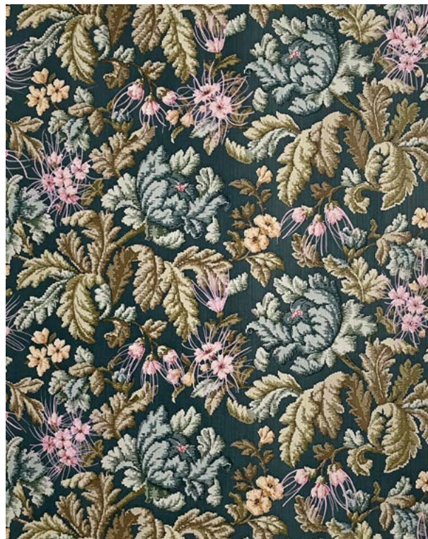
Oh le sale gosse ! 90 23-07-2023 60,7 x 47 cm