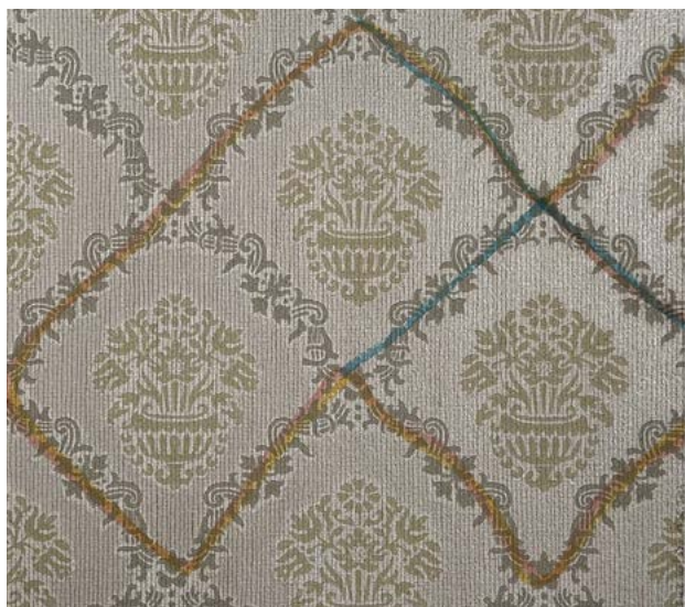
Oh le sale gosse ! 220 13-06-2024 45 x 49,7 cm