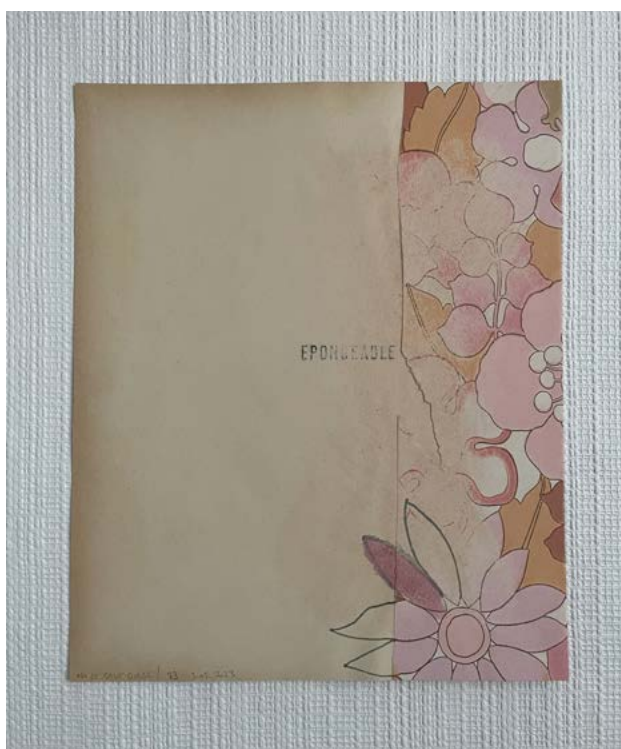
Oh le sale gosse ! 33 03-05-2023 40 x 33,1 cm