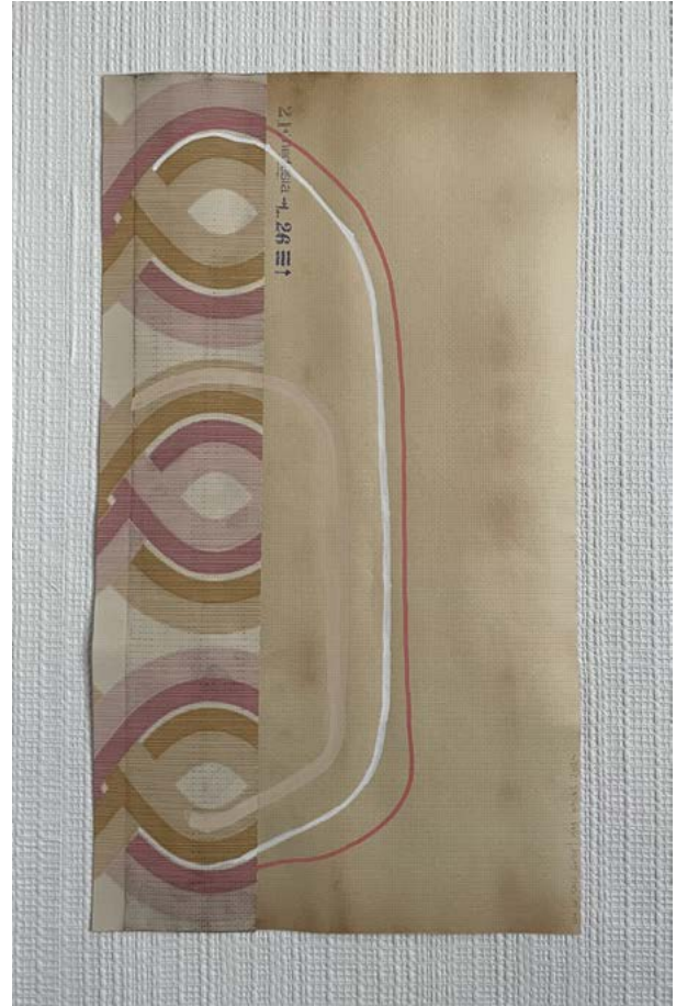
Oh le sale gosse ! 111 04-02-2024 53,2 x 29,9 cm