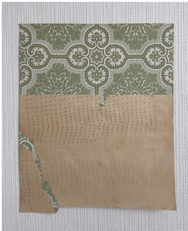
Oh le sale gosse ! 82 15-06-2023 78 x 45,9 cm