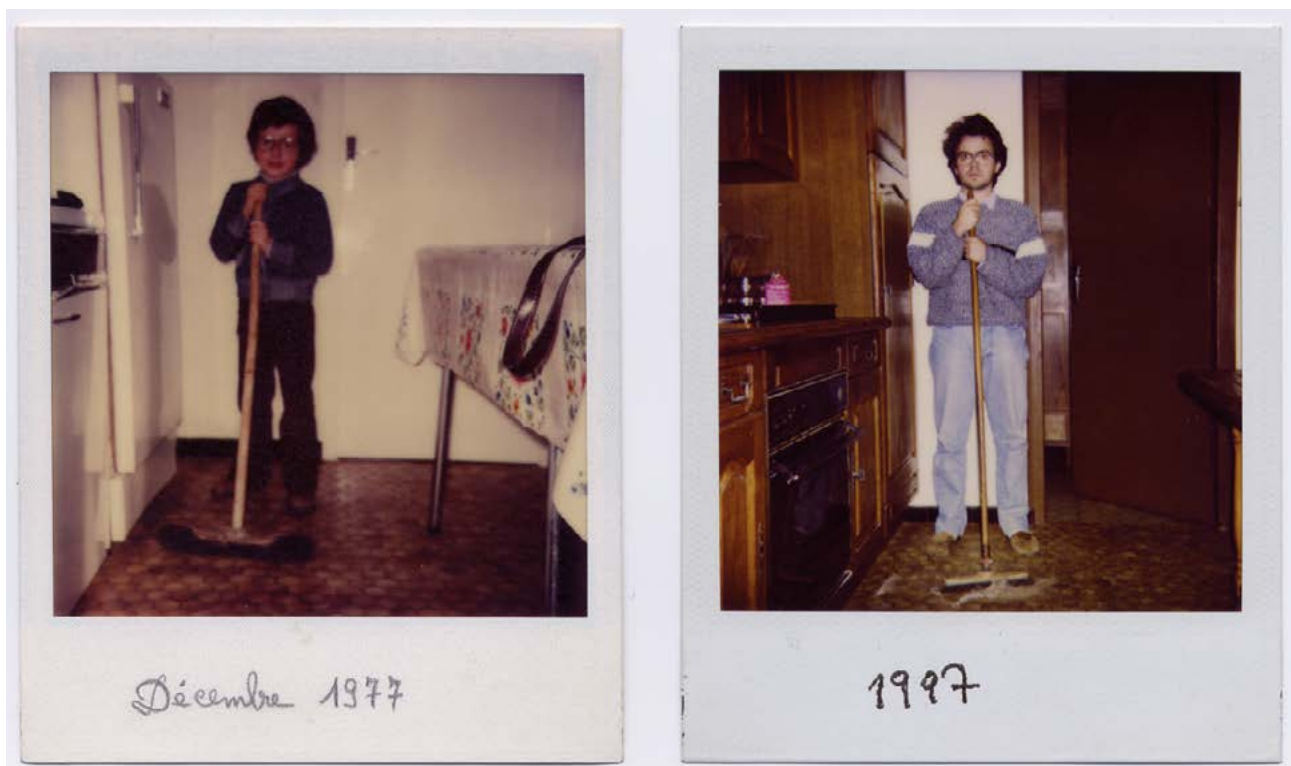
1977 - 1997 Polaroids