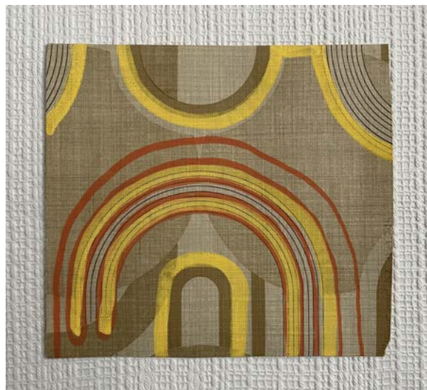
Oh le sale gosse ! 162 12-03-2024 18,8 x 20,6 cm