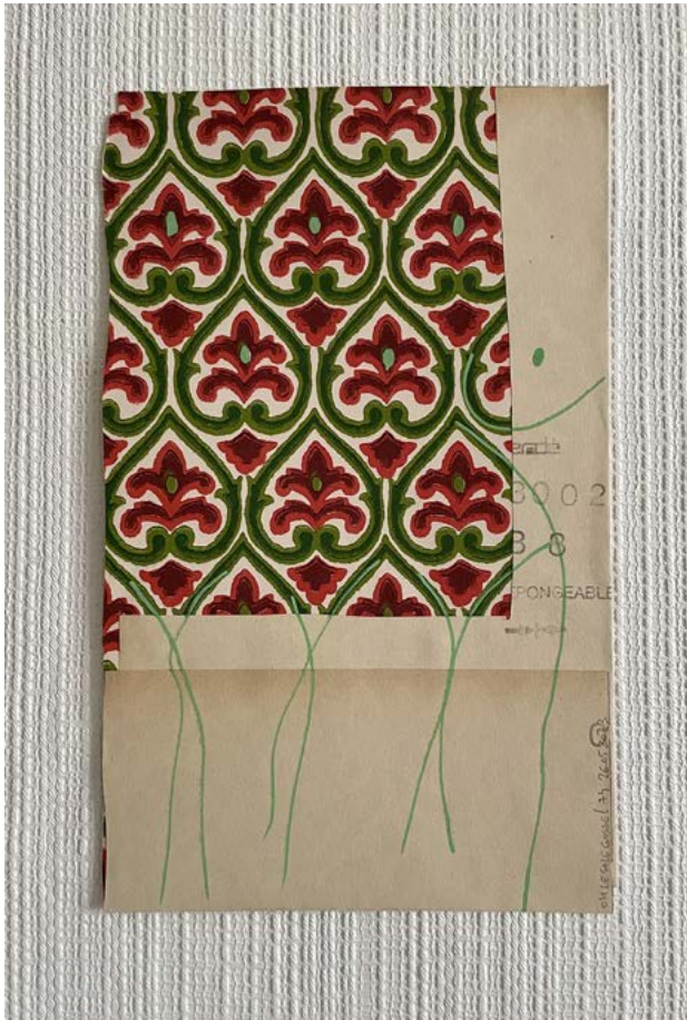
Oh le sale gosse ! 74 26-05-2023 37,5 x 23,4 cm