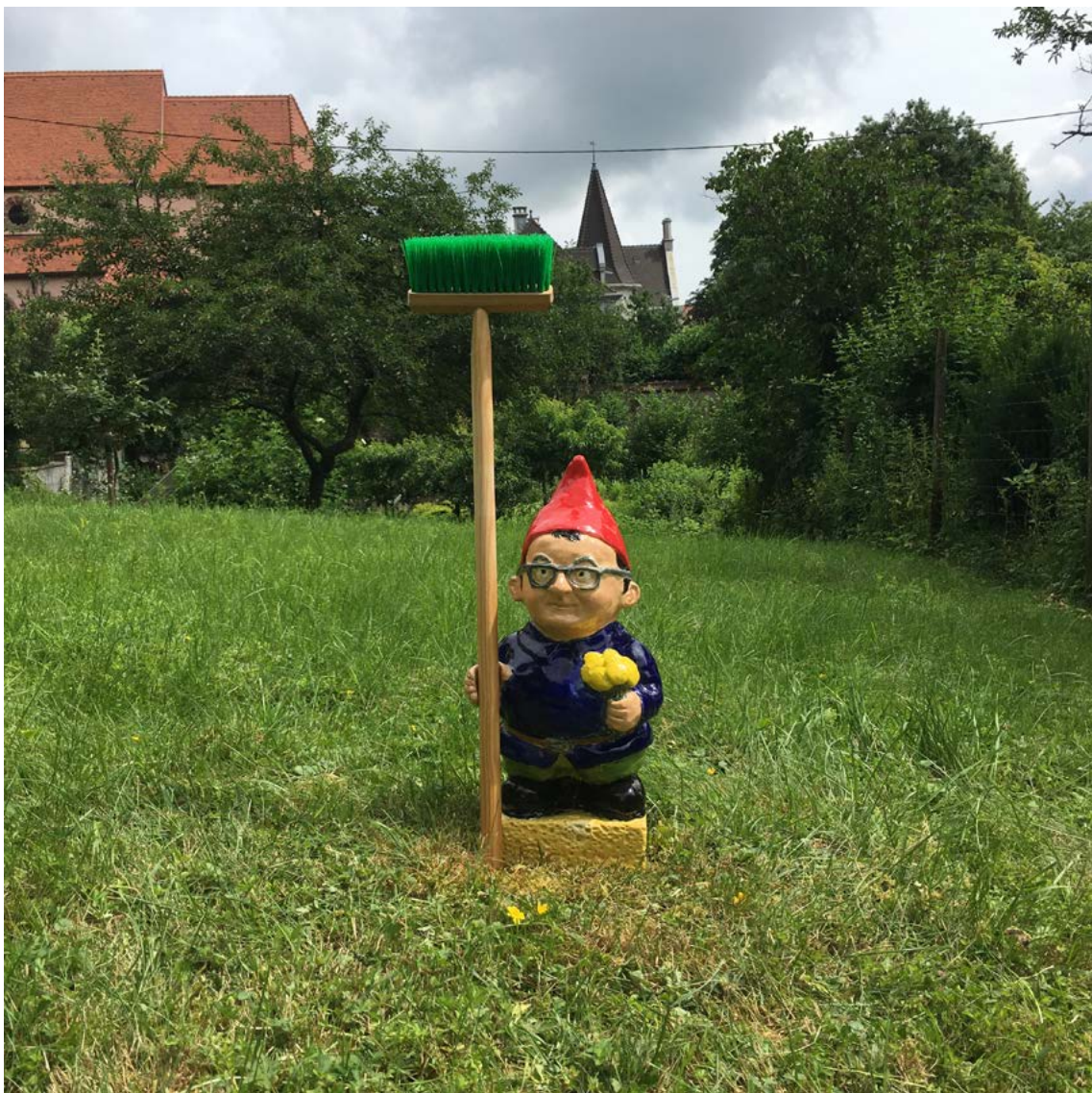
LE NAIN NETTOYEUR céramique et balai d'enfant pour la FEW 2018 (Fête de l'Eau de Wattwiller) du 10 au 24 juin 2018